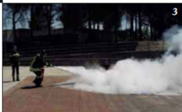
Foto 3 Si dirige sul fuoco spargendo la polvere alla base delle fiamme a ventaglio, al fine di coprire l'intera superficie interessata.

Foto 2 Inizia l'erogazione dell'estinguente posizionandosi sopravvento.