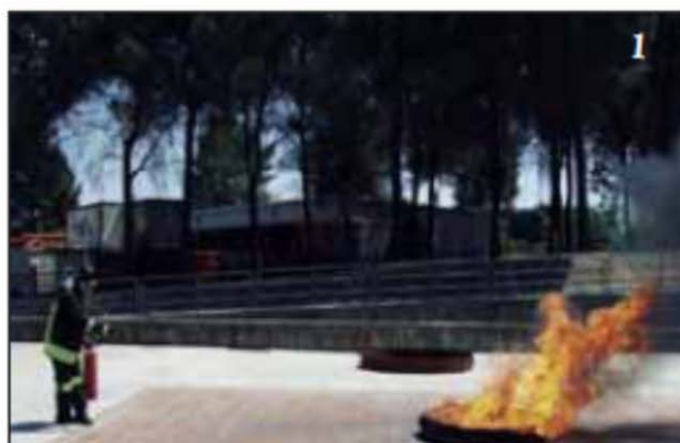
Foto 1 L'operatore è pronto per attaccare il fuoco con un estintore a polvere.